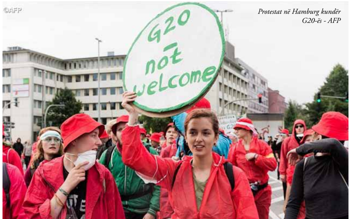
Protestat në Hamburg kundër G20-ës

Duke nënvizuar parimin e dytë, marrë nga Nxitja Apostolike “Evangelii Gaudium” e propozuar sot liderëve të G20-ës, mbledhur në Hamburg, Papa Françesku thekson se uniteti duhet të mbizotërojë mbi konfliktet. Në sa afrohet 100-vjetori i Letrës së Benediktit XV për Popujt në Luftë, Ati i Shenjtë Bergoglio kërkon fundin e masakrave të kota nëpër botë. Nuk do të jetë e mundur të arrihen objektivat ekonomike, nëse “palët nuk impenjohen t’i ulin thelbësisht nivelet e konfliktualitetit, të ndalin garën aktuale të armatimeve dhe përfshirjen e drejtpërdrejt ose tërthorazi në konflikte, si edhe të diskutojnë në mënyrë të sinqertë e transparente për të gjitha kundërshtitë”.